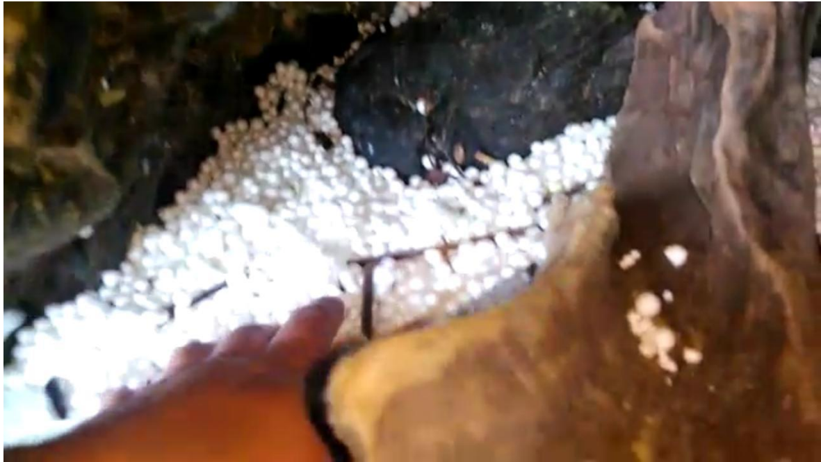
Foto 5 y 6 Interior de boyas comida por aves o mamíferos