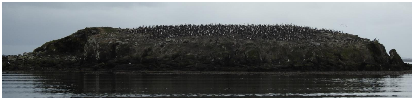
Foto 1: Colonia de Cormoranes en “prolongación de Punta Leopardo”

Cabe mencionar que existe una importante colonia de aves marinas (cormorán imperial, Liles, gaviota Austral) a menos de 4 km de uno de los principales basureros.